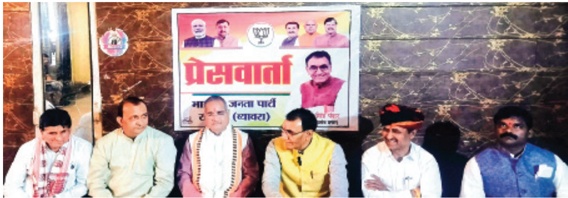
हरिभूमि न्यूज ▶▶ ब्यावरा

भी उल्लेखनीय प्रगति हुई है, जहां ग्रामीण अंचल से अध्ययन हेतु आने वाली बालिकाओं के लिए 100 बेड का कन्या छात्रावास उपलब्ध कराया गया है। उन्होंने विभिन्न विकास कार्यो के अगले चरण के लिए नवीन सीएम राइज स्कूल, एसडीएम कार्यालय, सुतालिया रोड का उन्नयन, राजगढ़ बायपास से पीपल चौराहा तक नवीन सड़क निर्माण, जनपद भवन एवं पार्वती पुल सहित अनेक महत्वपूर्ण परियोजनाओं का जिक्र किया।